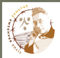
Titus Brandsma Carmelitano e Martire