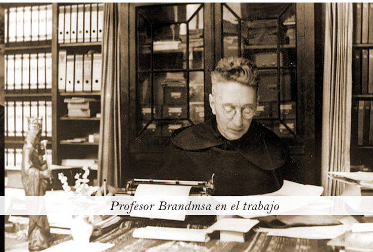
Profesor Brandmsa en el trabajo