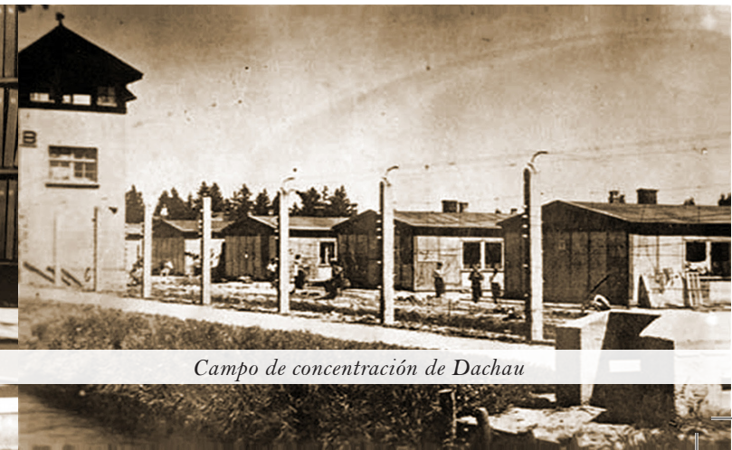
Campo de concentración de Dachau